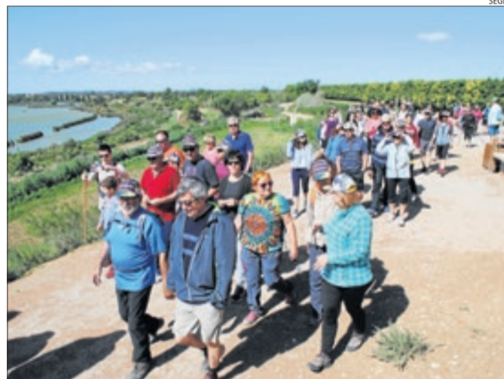
Una caminada a l'Estany d'Ivars, un dels espais en custòdia.