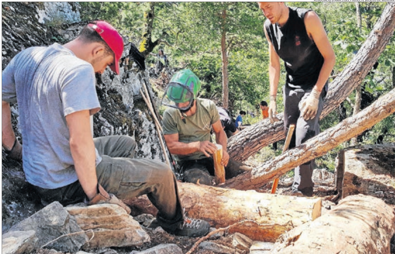
Voluntaris del Projecte Boscos de Muntanya treballen al camí d'accés al til·ler més antic de Catalunya, a Rialp.